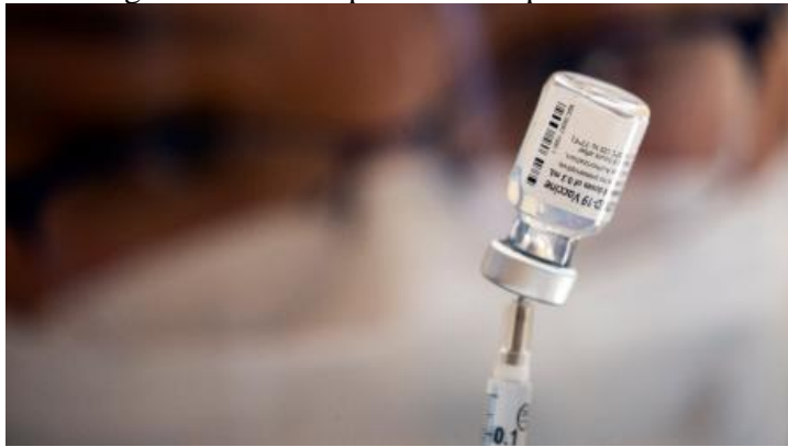
Vista de una dosis de la vacuna de Pfizer contra la COVID-19, en una fotografía de archivo.

El pasado viernes 11 de marzo se cumplieron dos años de que la Organización Mundial de la Salud declaró al COVID, la nueva enfermedad por el coronavirus SARS-CoV-2, como una pandemia, con lo que se reconocía que el mal se había esparcido ya por todo el planeta. Dos años que han cambiado al mundo. Dos años que nos trajeron muchas desgracias y muchas enseñanzas. Dos años que quedarán grabados para siempre en la historia de la humanidad. Dos años que permitieron a la población mundial darse cuenta de primera mano del poder que tiene la investigación científica para resolver problemas.